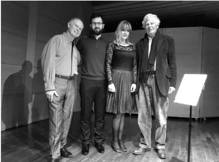
Duo Arcord Konzert vom 18. März 2017