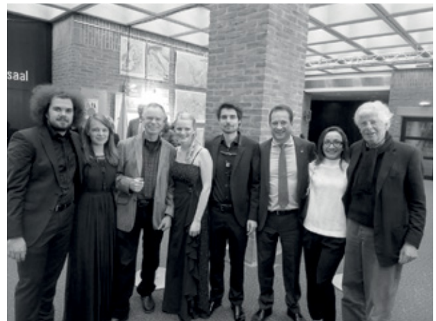
Nach Konzert 10. November 2016 Arcis Saxophon Quartett- mit dem Schweizer Generalkonsul Markus Thür und Gattin