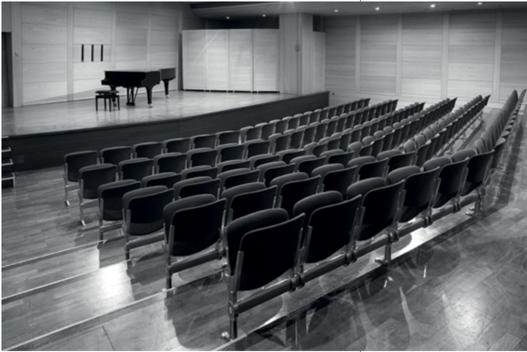
Kleiner Konzertsaal, Gasteig