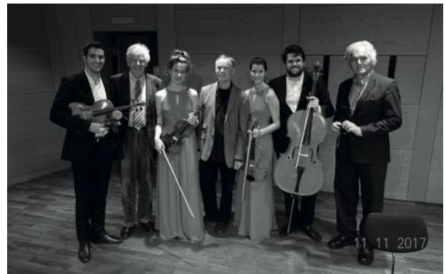
Nach dem Konzert Aris Quartett vom 11. November 2017